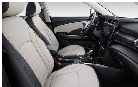
Interior bej (LBH)