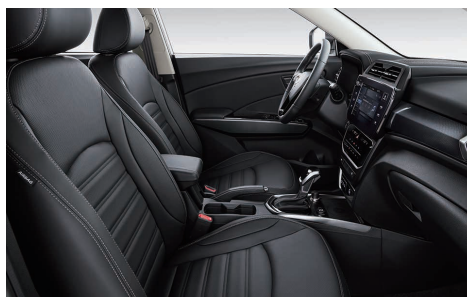
Interior negru (LBH)

Aceasta lista contine preturi de vanzare maxime recomandate. Atentie: Informațiile prezentate în sistemele digitale de pe autovehicul, meniul calculatorului de bord sau meniul sistemului Audio-Video-Navigație pot fi disponibile în limba engleză dar sunt prezentate și explicate în limba română în Manualul Utilizatorului și în Manualul Sistemului de Infotainment (Smart Audio, AVN). AW Distribution Kft. nu își asumă răspunderea pentru eventualele greșeli de tipar sau ale listei de prețuri. AW Distribution Kft. își rezerva dreptul de a aduce modificări prezentei liste de prețuri, ca urmare a unor erori, modificări structurale sau de preț, aparute în urma unor comunicări din partea producătorului Ssangyong. Prețurile sunt exprimate în Euro și se vor calcula în lei la cursul din ziua plății. Pentru detalii ale promoțiilor vă rugăm să vă adresați partenerilor autorizați Ssangyong. Informațiile afișate în diferite puncte din autovehicul pot fi în limba engleză dar sunt prezentate și explicate și în limba română în Manualul Utilizatorului. Valabil începând din 15 ianuarie 2024 până la revocare.