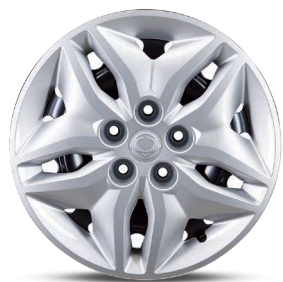
Jante oțel 16" cu pneuri 205/65 R16