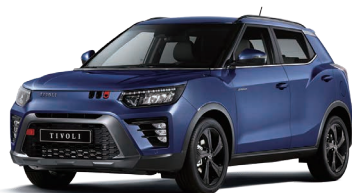
Albastru DANDY (metalizat) (BAS)