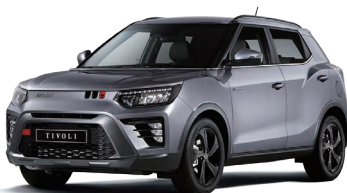
IRON metal (metalic) Argintiu (metalizat) (ADE)