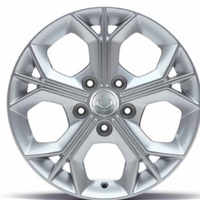
Jante aliaj 16" cu pneuri 205/65 R16