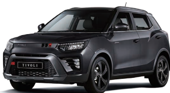
Negru SPACE (metalizat) (LAK)