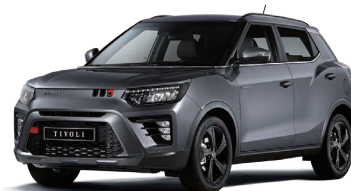
Gri PLATINUM GREY (metalizat) (ADA)