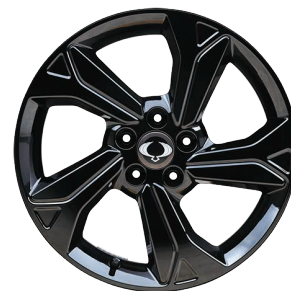
Jante aliaj 18" Diamond Cutting, negre, cu pneuri 215/50 R18

Aceasta lista contine preturi de vanzare maxime recomandate. Atentie: Informațiile prezentate în sistemele digitale de pe autovehicul, meniul calculatorului de bord sau meniul sistemului Audio-Video-Navigație pot fi disponibile în limba engleză dar sunt prezentate și explicate în limba română în Manualul Utilizatorului și în Manualul Sistemului de Infotainment (Smart Audio, AVN). AW Distribution Kft. nu își asumă răspunderea pentru eventualele greșeli de tipar sau ale listei de prețuri. AW Distribution Kft. își rezerva dreptul de a aduce modificări prezentei liste de prețuri, ca urmare a unor erori, modificări structurale sau de pret, aparute în urma unor comunicări din partea producătorului Ssangyong. Preturile sunt exprimate în Euro și se vor calcula în lei la cursul din ziua plății. Pentru detalii ale promoțiilor vă rugăm să vă adresați partenerilor autorizați Ssangyong. Informațiile afișate în diferite puncte din autovehicul pot fi în limba engleză dar sunt prezentate și explicate și în limba română în Manualul Utilizatorului. Valabil începând din 15 ianuarie 2024 până la revocare.