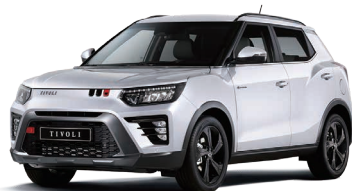
Alb GRAND (WAA)