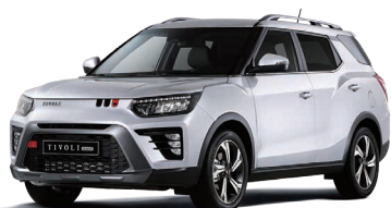
Alb GRAND (WAA)