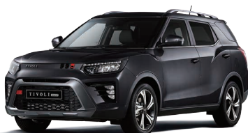
Negru SPACE (metalizat) (LAK)