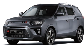
Gri PLATINUM GREY (metalizat) (ADA)