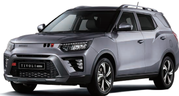
IRON metal (metalic) Argintiu (metalizat) (ADE)