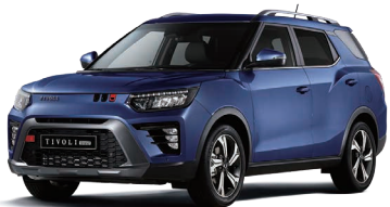
Albastru DANDY (metalizat) (BAS)