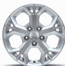
Jante aliaj 16" cu pneuri 205/65 R16