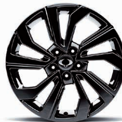
Jante din aliaj ușor de 18" Diamond Cut negre cu anvelope 215/50 R18