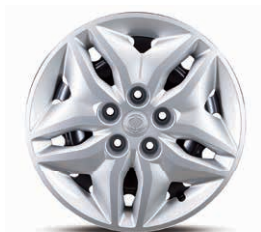
Jante din oțel de 16" cu anvelope 205/65 R16