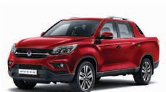
ROSU INDIAN (metalizat) (RAJ)