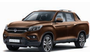
MARO MAROON (metalizat) (OAW)