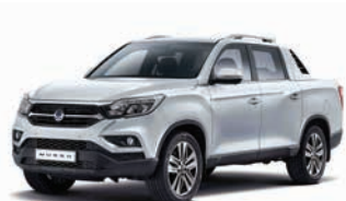
ARGINTIU FINE (metalizat) (SAF)