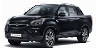
NEGRU SPACE (metalizat) (LAK)