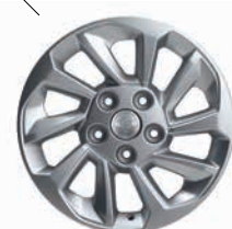
Jante de aliaj 17"