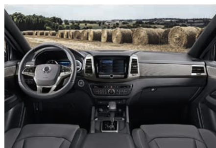
Tapițerie neagră cu tavan negru