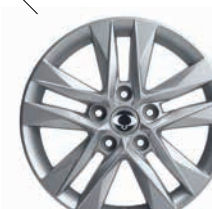
Jante de aliaj 18"