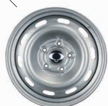
Jante de oțel 17"