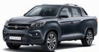
GRI MARBLE (metalizat) (ACM)

*5 ani / 100.000 km garanție de producător + încă 5 ani / până la 150.000 km garanție extinsă pentru motor, transmisie și sistem turbosuflantă