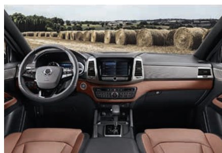
Maro – Tapițerie de piele, plafon de culoare neagră