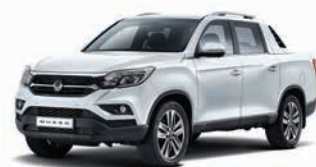
ALB PERLAT PEARL WHITE (sidefat) (WAK)