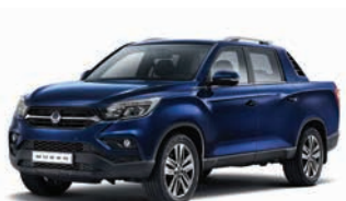
ALBASTRU ATLANTIC (metalizat) (BAU)